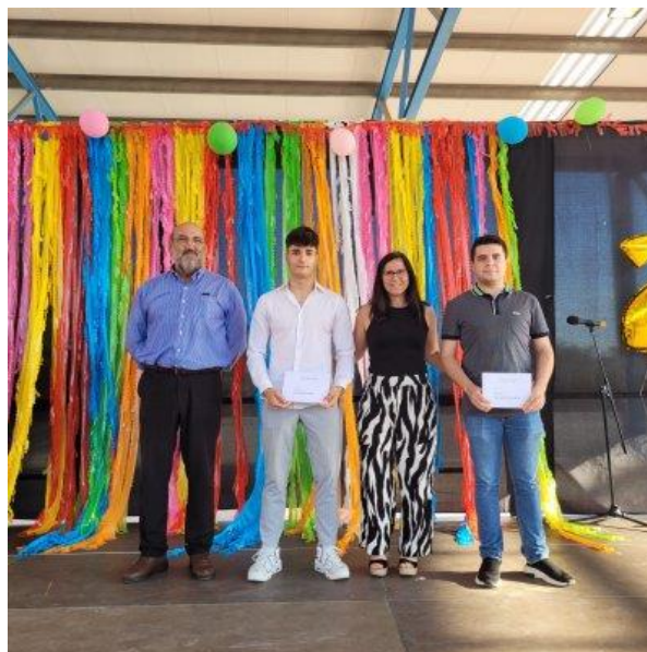
Lliurament beques Essity