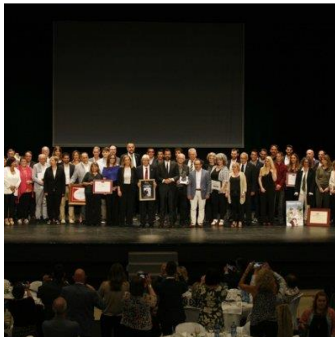
Guardonats a la Nit de Premis 2023