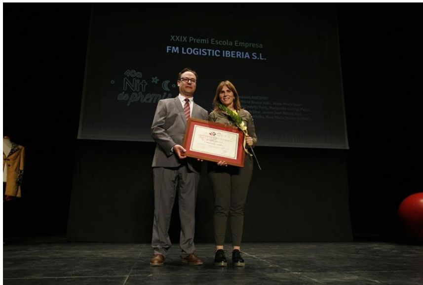
Lliurament premi Escola-Empresa

L'empresa creu fermament en la formació professional i, després dels períodes de pràctiques, a les seves instal·lacions, alguns dels alumnes han estat contractats per l'empresa on actualment hi desenvolupen la seva carrera professional.