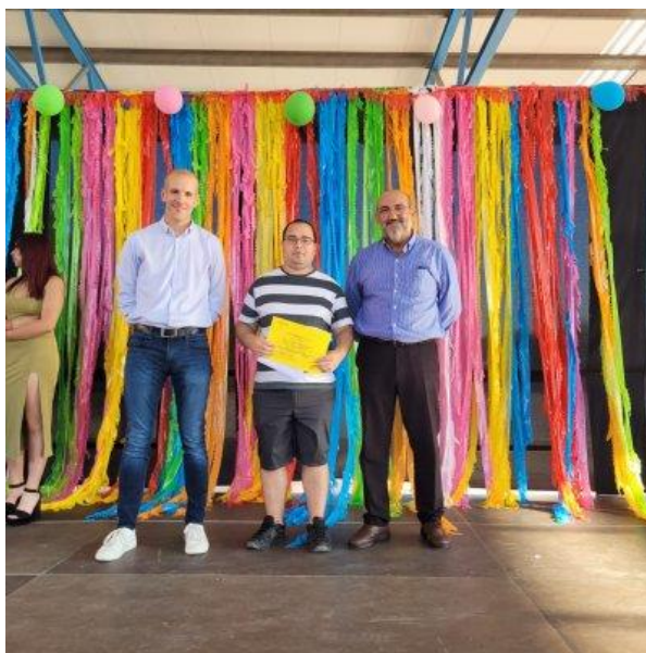
Lliurament beca Infordisa